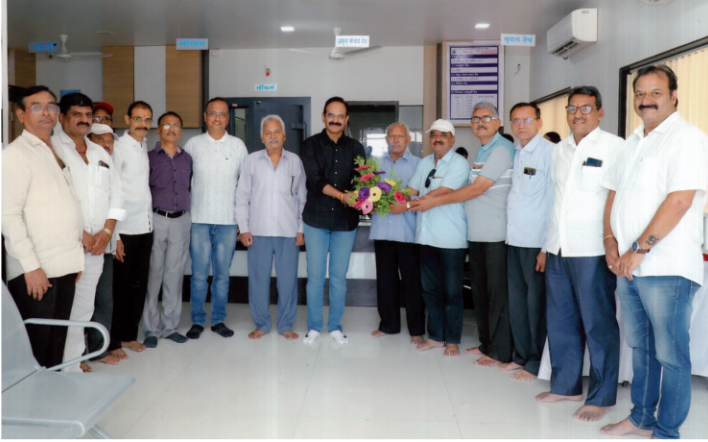
संस्थेच्या ३० व्या वर्धापन दिनानिमित्त मान्यवरांची भेट.